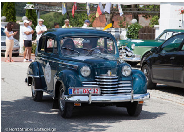
Opel Olympia Baujahr 1952 Senftl/Senftl