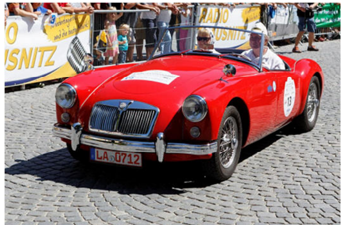
MG A Baujahr 1956 Pfaffenburner/Pfaffenburner