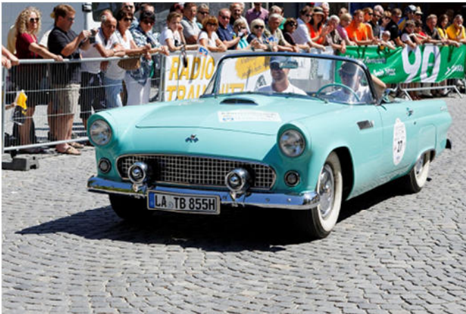
Ford Thunderbird Baujahr 1955 Schönreiter/Hasenöhr